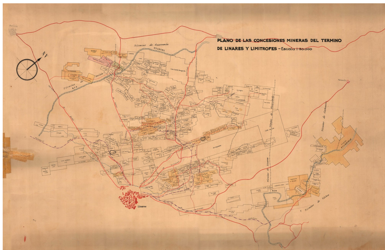
Figura 1: Plano de concesiones mineras de la zona S.O. del distrito Linares-La Carolina

Hemos hecho el estudio de los nombres de las minas, a partir de la información del Instituto de Estadística y Cartografía de Andalucía (Cartografía Histórica), sobre un total de 3.593 6 nombres de minas en el distrito en un periodo que va desde 1808 a 1970 (162 años), aunque solo hay 49 registros hasta 1855, por lo que la mayoría de las demarcaciones (el 99 %) corresponden a los 115 años comprendidos entre 1855 y 1970.