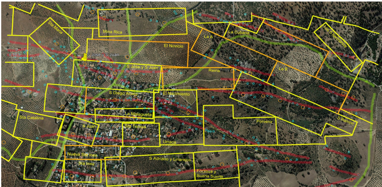
Figura 4: Representación de las antiguas concesiones mineras sobre una foto aérea (Google Earth) de la zona de la urbanización de San Roque. Las líneas amarillas representan los límites de las diversas concesiones; las líneas rojas la dirección y longitud aproximada de los filones; las líneas verdes son caminos o la carretera Linares-Guarroman; los círculos naranja los antiguos pozos maestros y los círculos azules los pocillos auxiliares. Aunque no están denominadas, casi todas las zonas entre concesiones correspondieron a demasías.

En cuanto al reino vegetal destacamos El Alcornoque, El Arrayan, El Carrascal, El Castaño, El Cerezo, El Lentisco, El Madroñal, El Manzanillo, El Manzano, El Mimbres, El Romero, El Romeral, Las Peras, Las Lechugitas, Los Frutos, Los Postres, El Melocotón, Los Mirtos, La Encina, La Breva, La Camelia, La Dalia (azul), El Encinar, La Manzana, La Naranja, La Piña, La Rosa, La Sabinilla, Las Adelfas, Las Cañadas, El Sauce Llorón, La Canela y El Café.