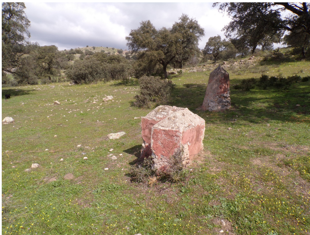
Figura 5: Mojones que aun persisten en el paisaje del distrito minero. Señalaban sobre el terreno los límites de las diversas concesiones.

- Son muy llamativos los nombres de minas que hemos agrupado como nombres que podríamos pensar que se refieren a las sensaciones o expectativas que puede ocasionar la incertidumbre de una mina que comienza a trabajarse. Así tenemos La Carambola, La Casualidad, La Codiciada, La Descubierta, La Duda, Dudosa, La Encontrada, La Encantada, La Escondida, La Esperanza, La Ilusión, La Inesperada, La Imprevista, La Ocasión, Perseguida, La Perseverancia, La Sorpresa, La Suerte, La Laboriosidad, La Ventura, Los Tramposos, El Misterio, El Olvido, El Porvenir, Precaución, La Prudencia, La Providencia, La Sorpresa, El Hallazgo.